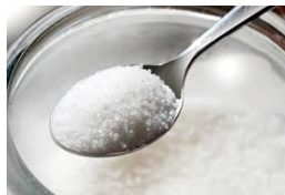
A spoonful of sugar