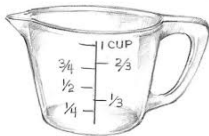
A cup of water